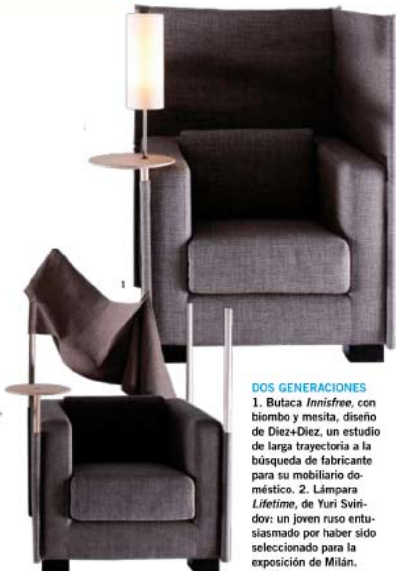
DOS GENERACIONES 1. Butaca Innisfree , con biombo y mesita, diseño de Diez+Diez, un estudio de larga trayectoria a la búsqueda de fabricante para su mobiliario doméstico. 2. Lámpara Lifetime , de Yuri Sviridov: un joven ruso entusiasmado por haber sido seleccionado para la exposición de Milán.